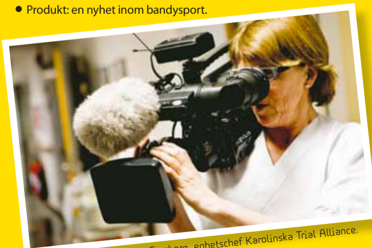
Bakom kameran: Eva-Lena Forsberg, enhetschef Karolinska Trial Alliance.